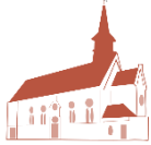
St. Johann Nepomuk Zwickau